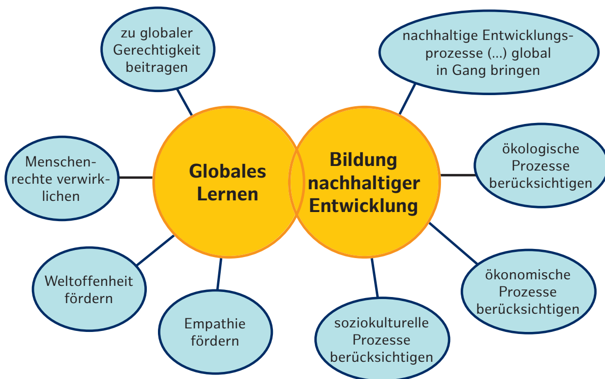
Die soziale, ökologische und ökonomische Verschränkung der beiden Bereiche ist im dafür entwickelten Schaubild dargestellt.